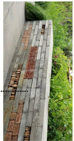
renovatie dierenweide T'DOK - ontwerp 13-01-2021 - schaal 1:100 - Multi-tuin en Landschap